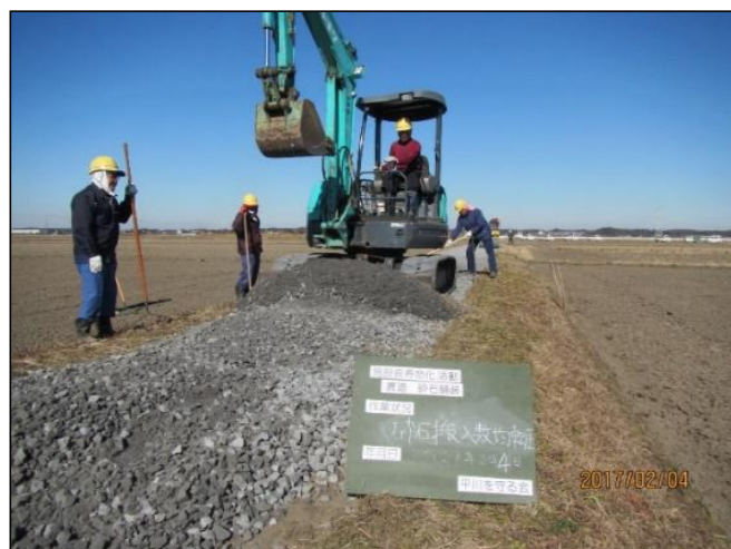
農道砕石舗装工事