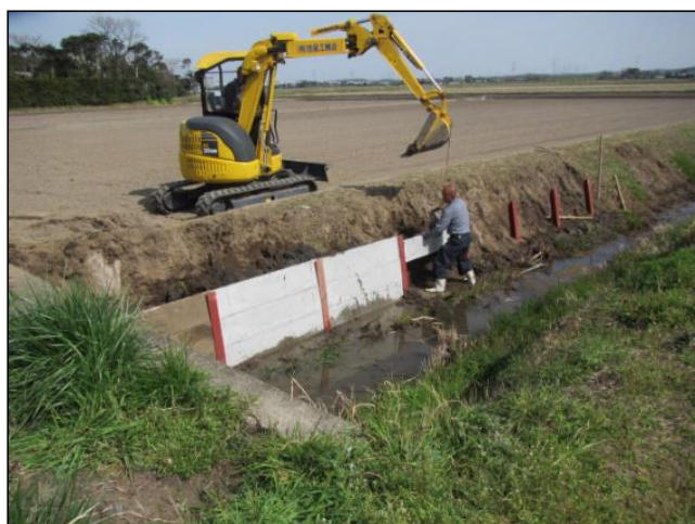
水路法面崩壊対策工事