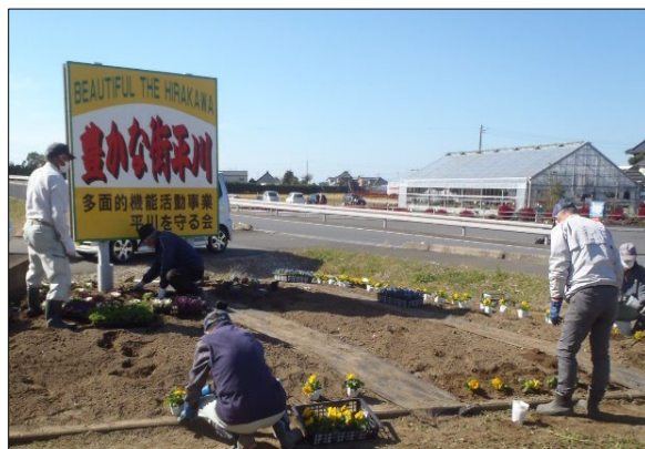
シニアクラブとの花苗の植栽