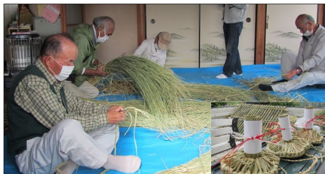
（御奉射） 稲わら文化の伝承 （七夕馬）