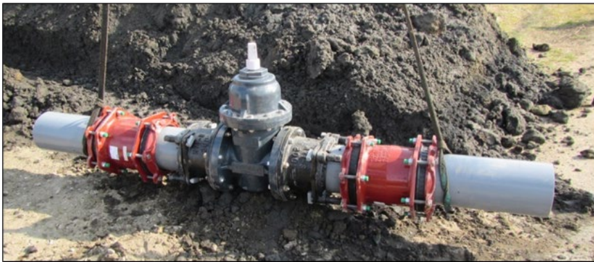
新しい仕切弁に替えました（口径 200 mm）