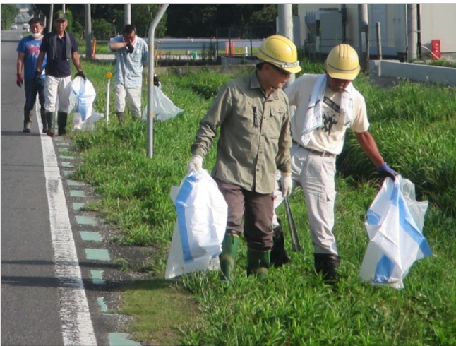
地域の清掃作業（缶拾い）