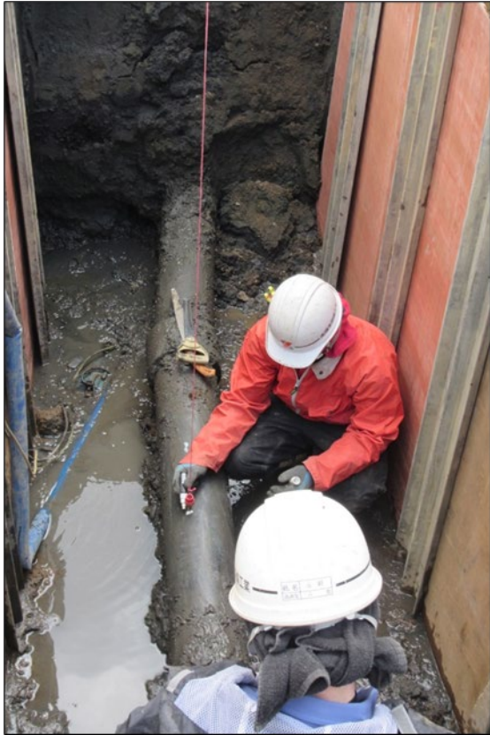
仕切弁更新 その1工区