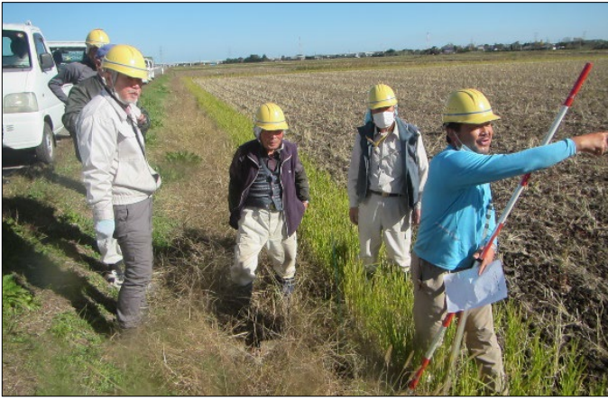
施設（パイプライン）の点検・機能診断

農用地・水路・農道を点検し策定した活動計画による草刈り・水路の泥上げ・農道路面の維持など基本的な保全活動や意見交換会等の推進活動。機能診断し策定した活動計画による水路・農道の軽微な補修などの共同活動。子ども会との水質検査やシニアクラブとの植栽活動、桜並木の管理、缶拾いなどの環境保全活動、広報活動として公式ホームページ・ブログの更新。御奉射や七夕まつりを通した稲わら文化の伝承、地域の結びつきを強化するための増進活動を行いました。