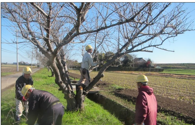
桜並木の管理（除草・剪定）