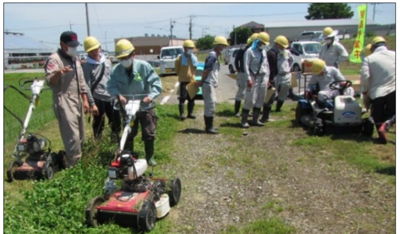
草刈機安全使用講習会