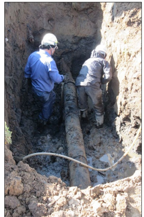
仕切弁更新 その2工区